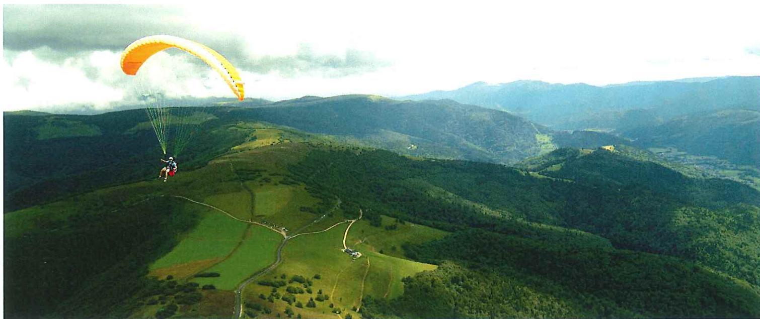
Les Crêtes © Michel Laurent