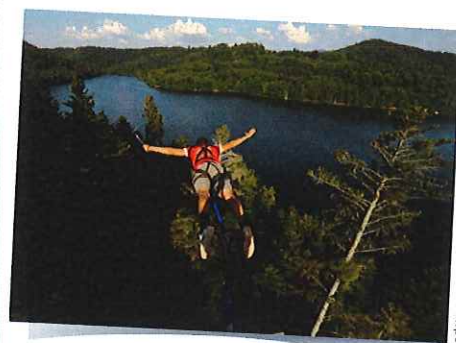
Lac de Pierre-Percée