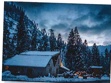
Sclerie du Lançois