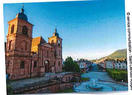
Cathédrale de Saint-Dié-des-Vosges